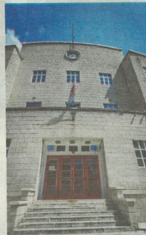
Srednjoškolci su u širokom luku zaobišli staru, dobru šibensku Gimnaziju

Štrajk će se potom nastaviti 9. travnja u Koprivničko-križevačkoj, Varaždinskoj i Medimurskoj županiji, a 11. travnja i u Bjelovarsko-bilogorskoj, Sisačko-moslavačkoj, Karlovačkoj, Krapinsko-zagorskoj i Zagrebačkoj županiji te Gradu Zagrebu. ●